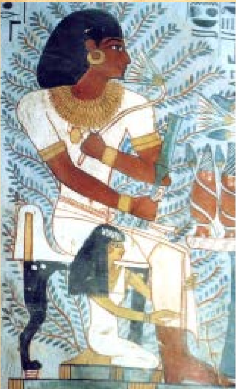
Merit y su esposa Sennefer