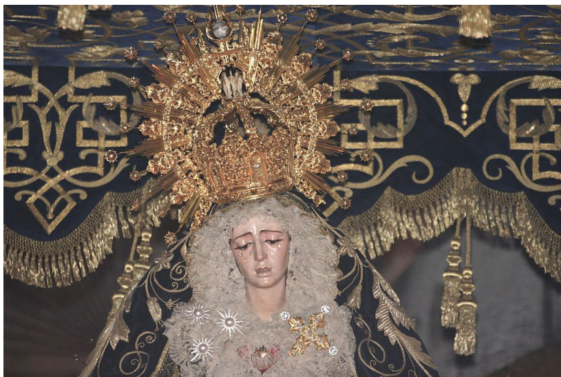
Virgen de la Estrella

En Sevilla realizó numerosos trabajos, bien en una primera etapa junto a su padre, como también posteriormente junto a su esposo, que firmaría los contratos de numerosas obras. Destaca su producción de imágenes marianas para parroquias y cofradías, como la de la Estrella, realizando vírgenes dolorosas para procesionar, así como otras imágenes de pasos de Semana Santa, colaborando con su padre en paseo de la Exaltación para el que haría figuras de ángeles y probablemente las de los ladrones.