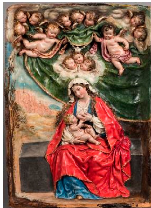
Virgen de la Leche

https://ceres.mcu.es/pages/Viewer?accion=4&AMuseo=MBASE&Ninv=DJ0361E