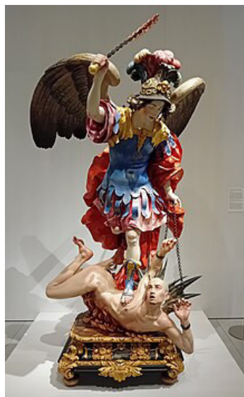
El arcángel San Miguel venciendo al demonio

https://commons.wikimedia.org/wiki/User:CarlosVdeHabsburgo