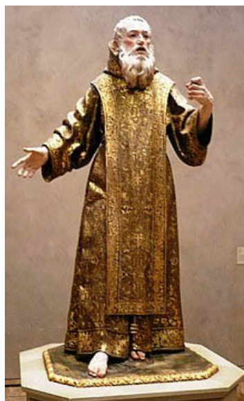
San Ginés de la Jara

Fecha en 1692 son dos obras principales de la imaginera: una escultura de San Ginés de la Jara que se exponen en la actualidad en la Fundación Getty y la afamada escultura del Arcángel San Miguel venciendo al demonio, destinada al Monasterio de San Lorenzo de El Escorial.