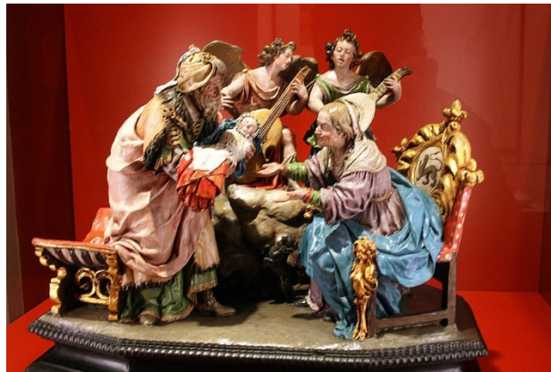
San Joaquín y Santa Ana con la Virgen Niña. Expuesto en el Museo de Guadalajara procedente del monasterio de Sopetrán

grupos de escultura en terracota, de gran belleza, que tuvieron gran aceptación en el mercado del arte de la época, y tuvieron su comienzo con la obra El descanso en la huida a Egipto (c.1691).